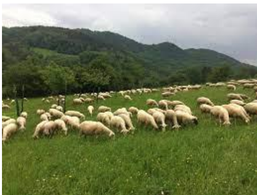
Reštaurácia: Salaš Nimnica

Salaš Nimnica - chov oviec a s tým spojené obhospodarovanie pozemkov, ktoré sú potrebné pre celoročnú existenciu chovu a počas sezóny je rozšírená o predaj klasických ovčiarskych výrobkov v predajni ovčej farmy Nimnica